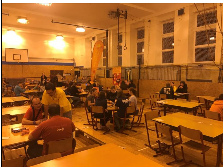
Hraju, hraješ, hrajeme