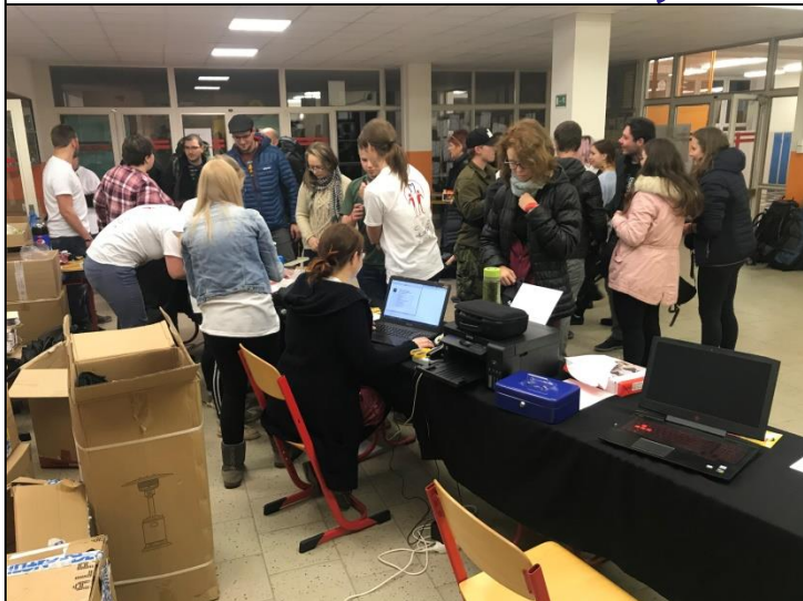
Tradiční frmol při registraci